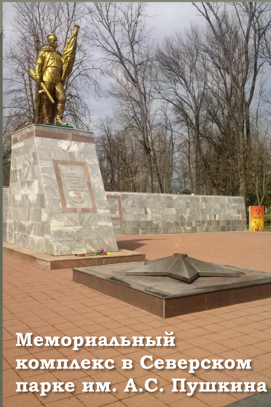
Мемориальный комплекс в Северском парке им. А.С. Пушкина

В 1943 году в братской могиле было захоронено 187 воинов погибших в боях с фашистскими захватчиками при освобождении станции Северской и населенных пунктов Северского района.