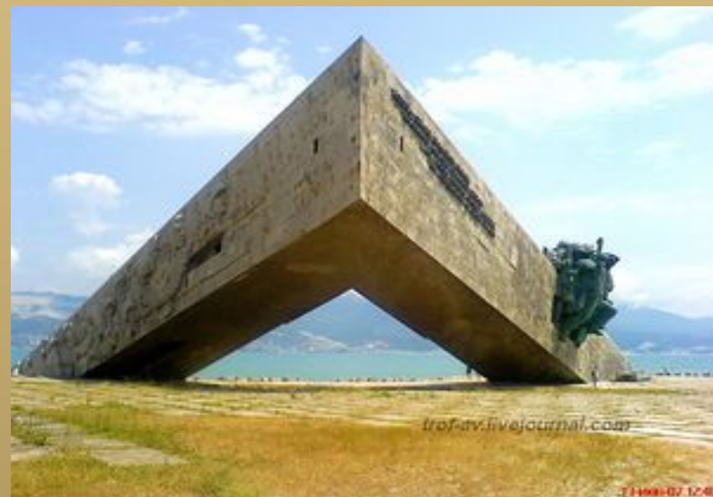
мемориал «Малая земля»