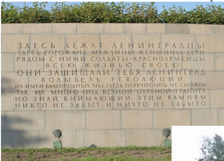
Мемориальный ансамбль на Пискаревском кладбище

убито 16744 человека ранено 33782 человека умерло от голода 641803 человека