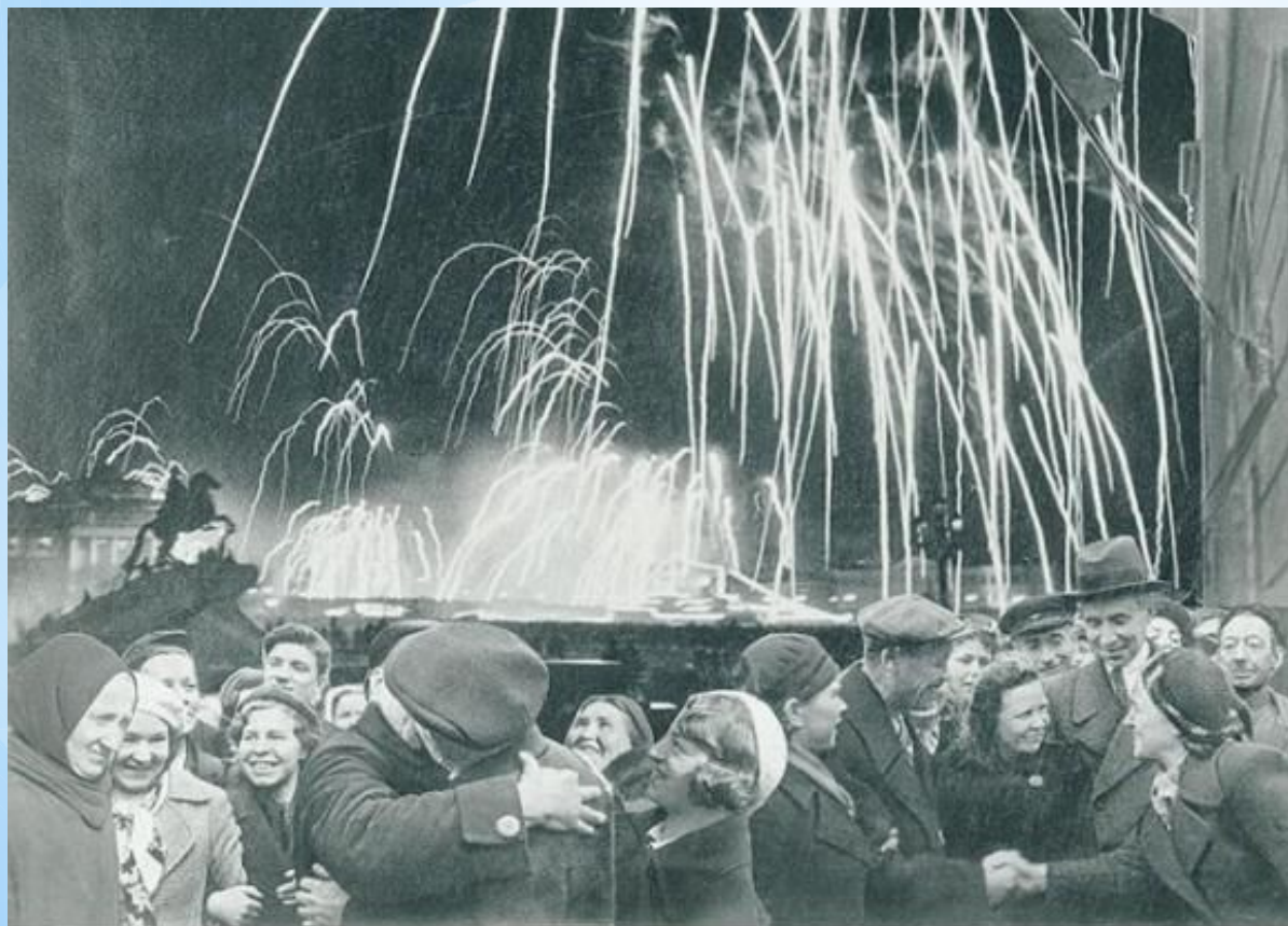
-Великая победа одержана советскими войсками под Ленинградом:

27 января 1944 года Ленинград салютовал 24 залпами из 324 Орудий в честь полной ликвидации вражеской блокады- разгрома немцев под Ленинградом.